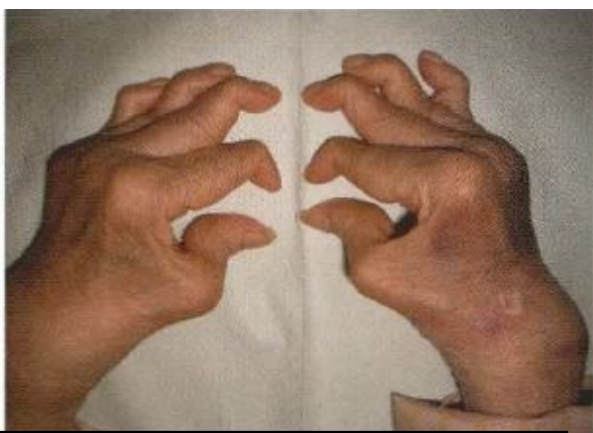
スワンネック変形