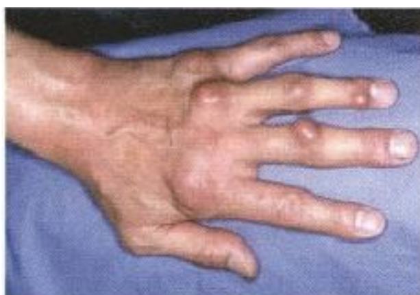
実際のリウマトイド結節

皮下結節はリウマチ患者の約25%にみられます。特に肘や膝の前面や後頭部など、圧迫されやすい部位に生じます。