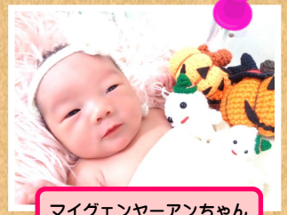
マイグエンヤーアンちゃん