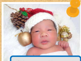
バジャファラージュローくん