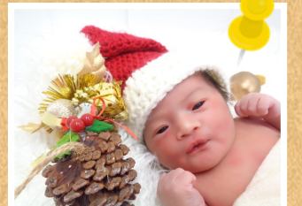
コンタガム ミオちゃん